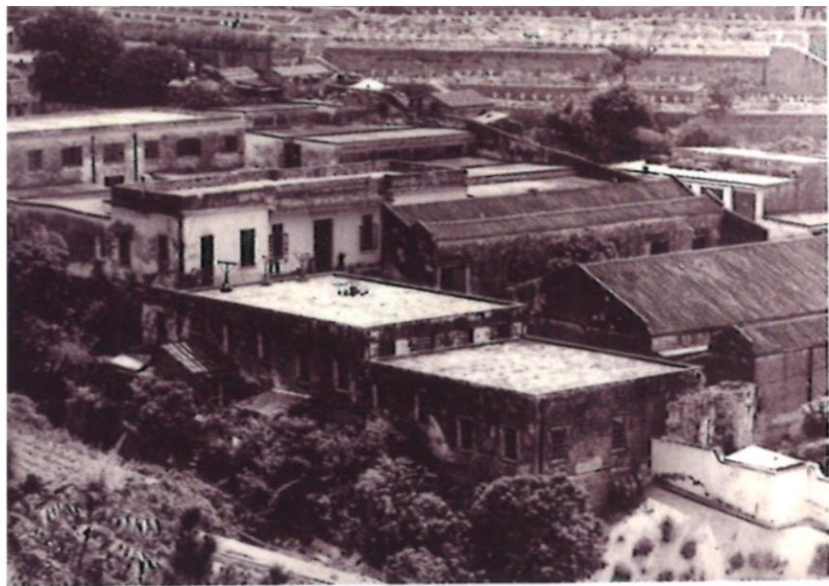
👉 20世紀初的東華義莊