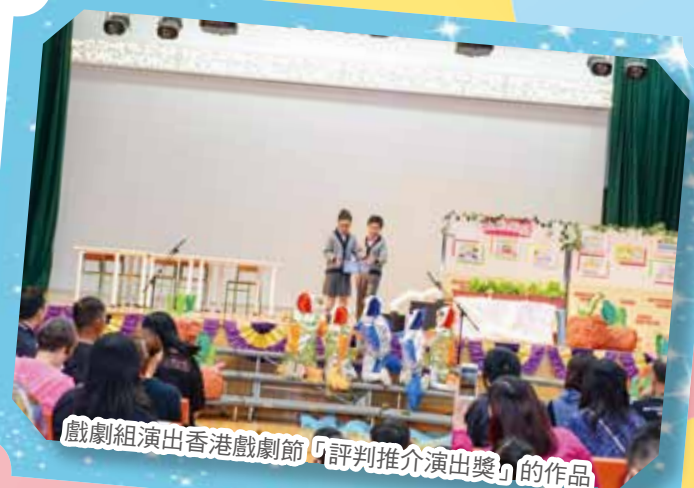
戲劇組演出香港戲劇節「評判推介演出獎」的作品