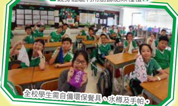
全校學生需自備環保餐具、水樽及手帕。