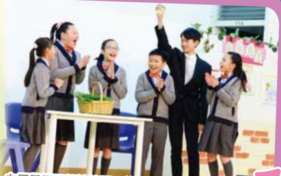
在同學們互相扶持下，終於得到美滿的收成。