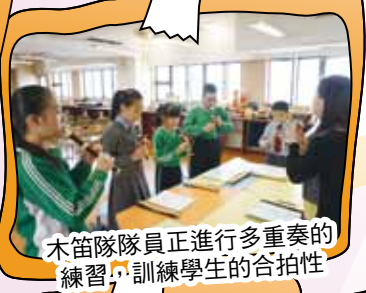
木笛隊隊員正進行多重奏的練習，訓練學生的合拍性