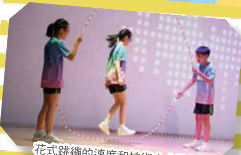
花式跳繩的速度和技術令人驚歎