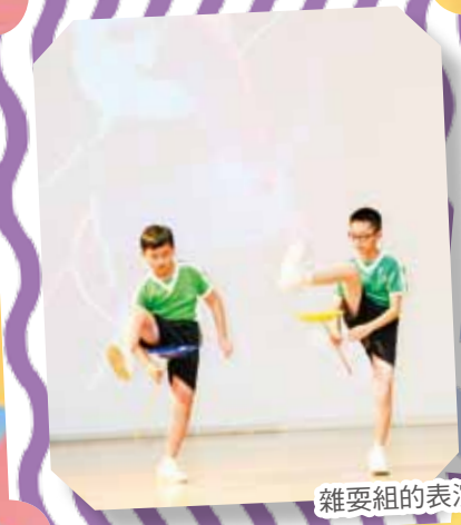
雜耍組的表演令同學大開眼界