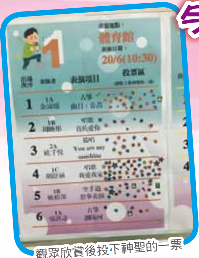
觀眾欣賞後投下神聖的一票