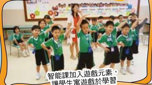
智能課加入遊戲元素，讓學生寓遊戲於學習