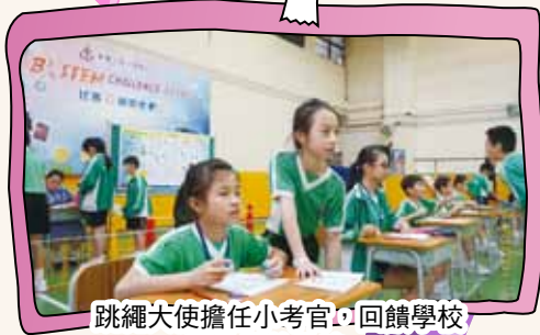
跳繩大使擔任小考官，回饋學校對他們的栽培。