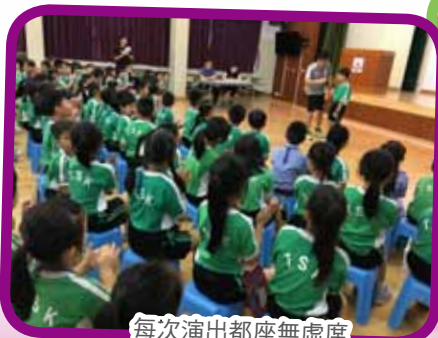
每次演出都座無虛席