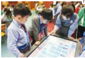
Students concentrate on the matching game in the Activ table