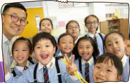
完成了第一次表演，真高興!