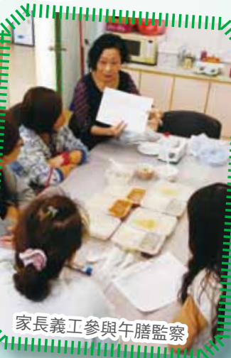
家長義工參與午膳監察