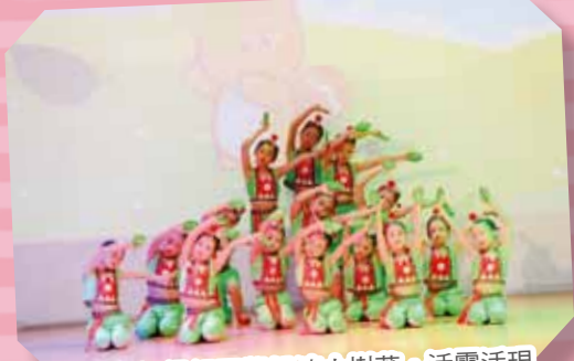
東方舞初級組同學扮演小樹葉，活靈活現