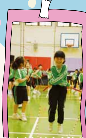
同學們在小息時段享受跳繩的樂趣。