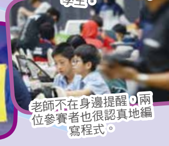
老師不在身邊提醒，兩位參賽者也很認真地編寫程式。