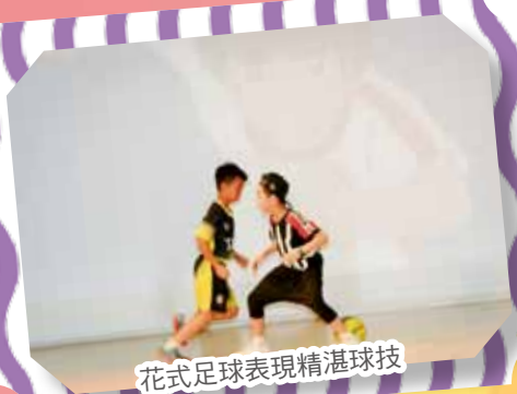
花式足球表現精湛球技