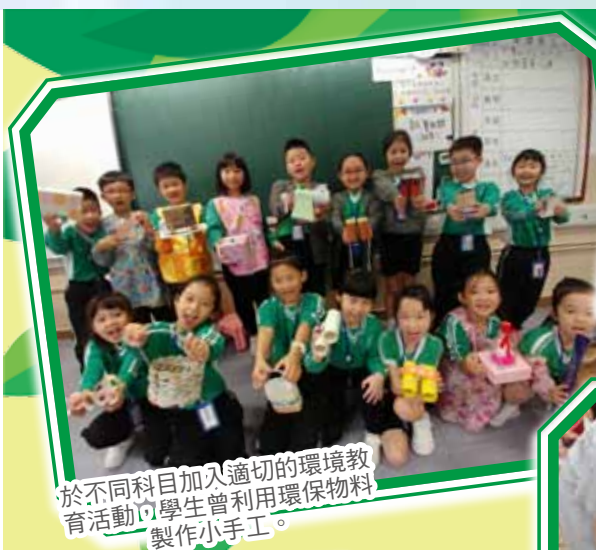
於不同科目加入適切的环境教育活動，學生曾利用環保物料製作小手工。

本校會繼續努力，定期檢討環境教育政策，以配合時代的步伐，讓全校上下共同為環境保護出一分力。