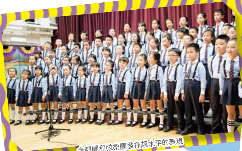
合唱團和弦樂團發揮超水平的表現