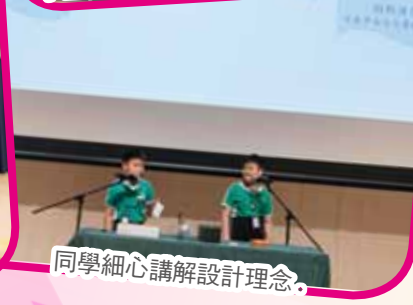
同學細心講解設計理念。