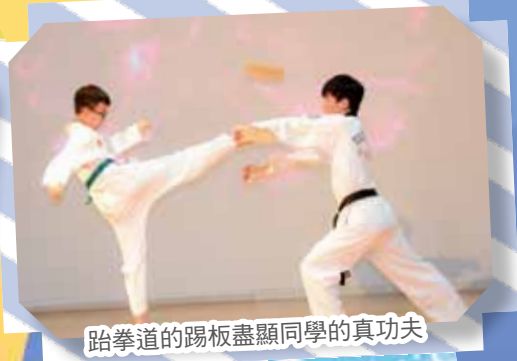
跆拳道的踢板盡顯同學的真功夫