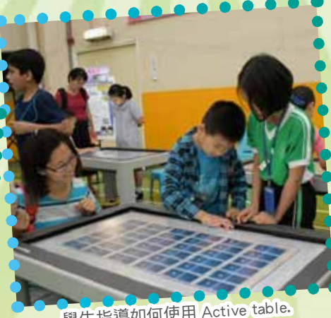
學生指導如何使用 Active table.