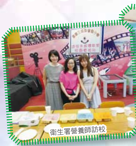
衛生署營養師訪校

在此特別感謝家長義工的協助，作出不定時的午膳監察，確保午膳質素。本校同學亦已建立良好習慣，主動帶健康小食回校。經各方面的努力，本校今年繼續獲衛生署營養師評定為至「營」學校。