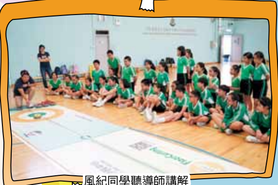
風紀同學聽導師講解