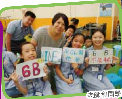
老師和同學自製打氣橫額