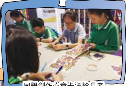
同學創作心意卡送給長者