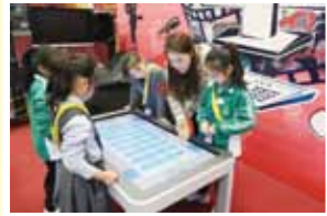
Students use Activ table with the guidance of teacher