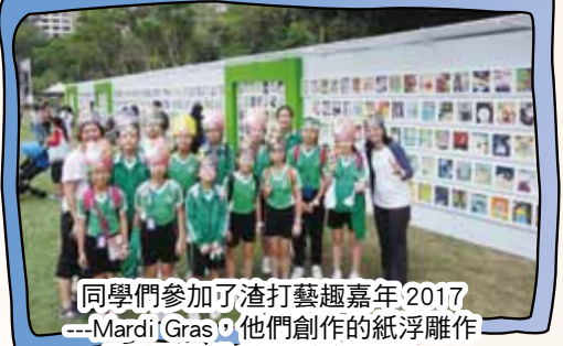
同學們參加了渣打藝趣嘉年 2017 - Mardi Gras，他們創作的紙浮雕作品在香港維多利亞公園展出。