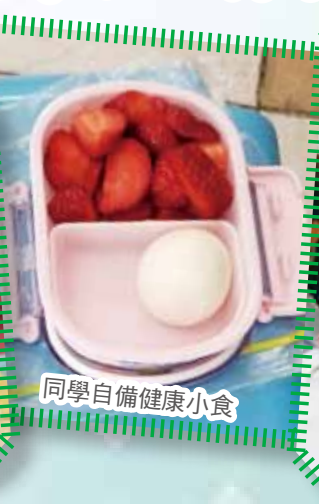
同學自備健康小食