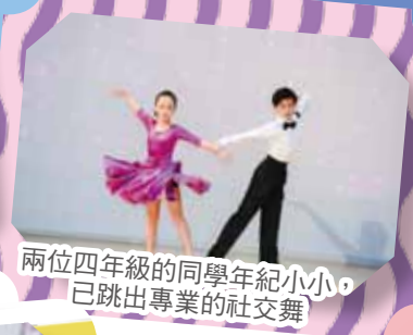
兩位四年級的同学年紀小小，已跳出專業的社交舞