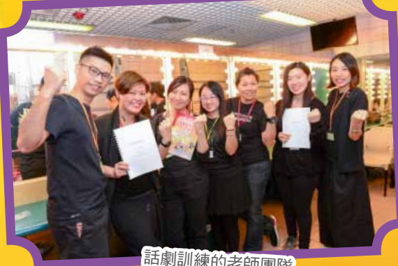
話劇訓練的老師團隊