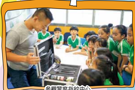
參觀警察指紋中心