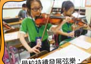
學校持續發展弦樂，培育不少音樂人材