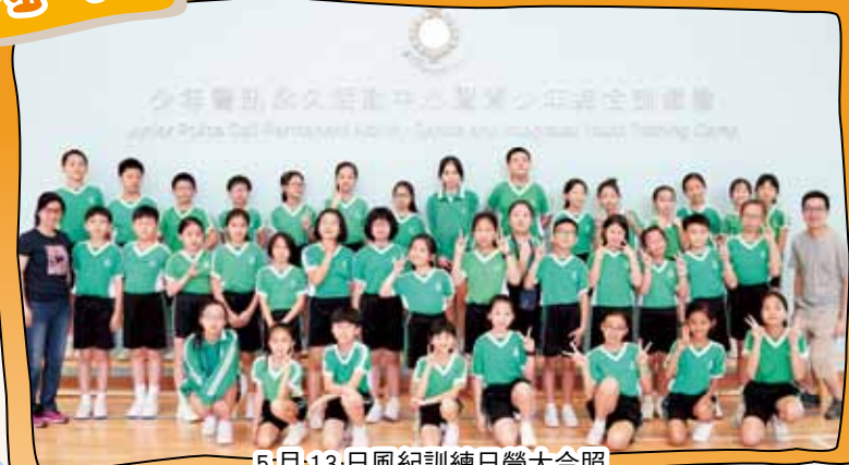
5月13日風紀訓練日營大合照