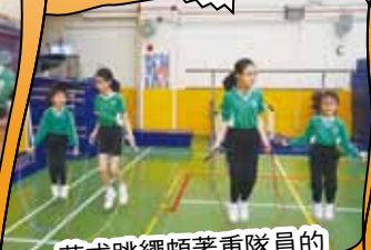
花式跳繩頗著重隊員的合作精神