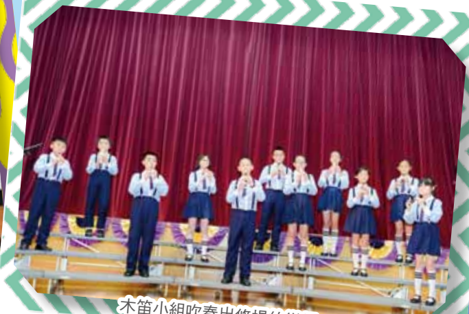
木笛小組吹奏出悠揚的樂韻