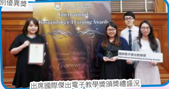
出席國際傑出電子教學獎頒獎禮盛況