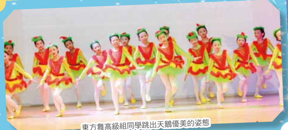
東方舞高級組同學跳出天鵝優美的姿態