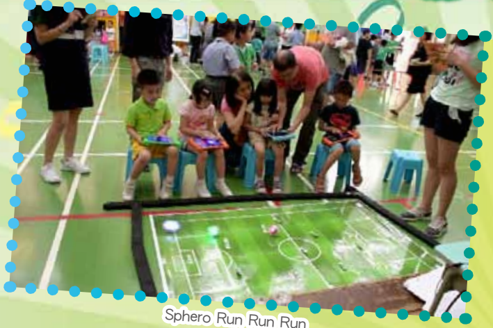
Sphero Run Run Run

東華三院向來重視提升學生多元智能，教育服務與時並進。近年，本校積極進行課程改革，並以資優教育、語文教育、電子學習及「STREAM」（科學、科技、閱讀 / 探究、工程、藝術、數學）為教育發展重點。