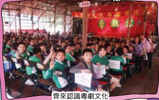
齊來認識粵劇文化