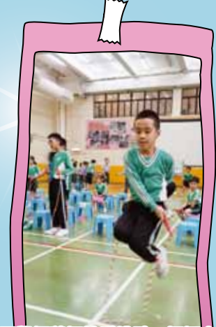
同學們積極接受挑戰!! 振翅高飛!