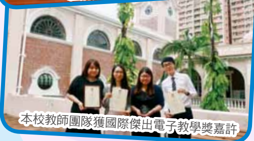
本校教師團隊獲國際傑出電子教學獎嘉許

去優化校本課程，激發學生的學習動機及提升學與教效能的成功案例。；而《機器車編程培養計算思維能力》則透過探究式課堂動手做任務切入，培育學生從「願意學」到「懂得學」，具備自主學習和計算思維綜合應用解難的能力，成就每位學生成功的學習經歷。