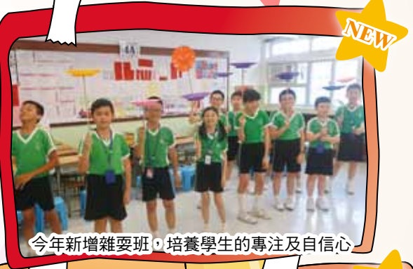
今年新增雜耍班，培養學生的專注及自信心