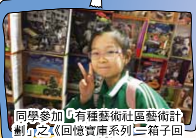
同學參加「有種藝術社區藝術計劃」之《回憶寶庫系列「箱子回憶」》，他們作品在中環中心展出