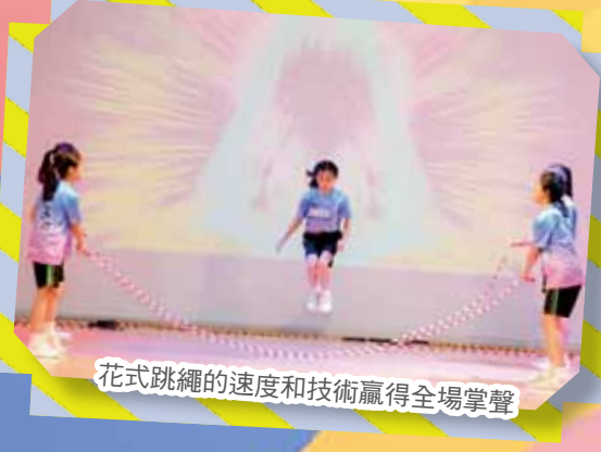
花式跳繩的速度和技術贏得全場掌聲