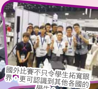
國外比賽不只令學生拓寬眼界，更可認識到其他各國的學生。