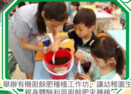
舉辦有機廚餘肥種植工作坊，讓幼稚園生能親身體驗利用廚餘肥來種植。