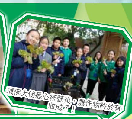
環保大使悉心經營後，農作物終於有收成了！