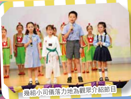
幾組小司儀落地地為觀眾介紹節目