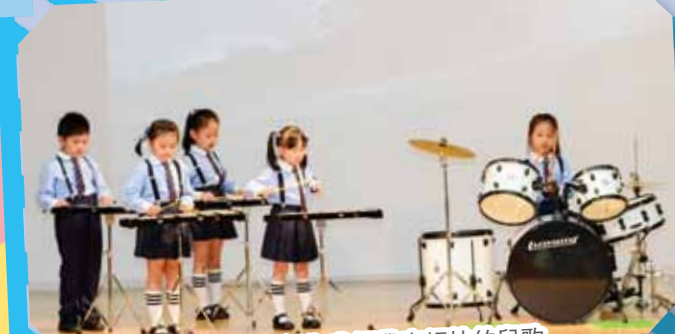
敲擊樂小組為我們帶來輕快的兒歌