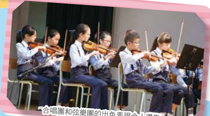
合唱團和弦樂團的出色表現令人讚歎