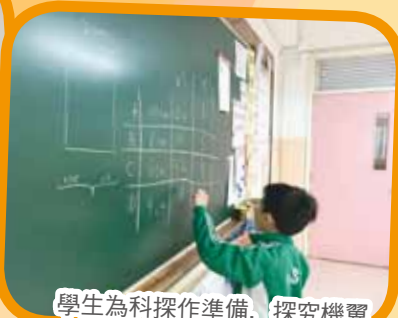
學生為科探作準備，探究機翼闊度和滯空時間的關係。