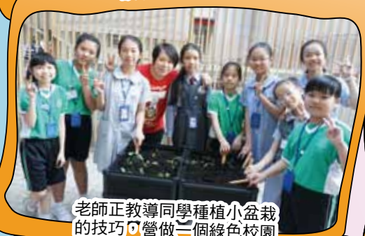
老師正教導同學種植小盆栽的技巧，營做一個綠色校園