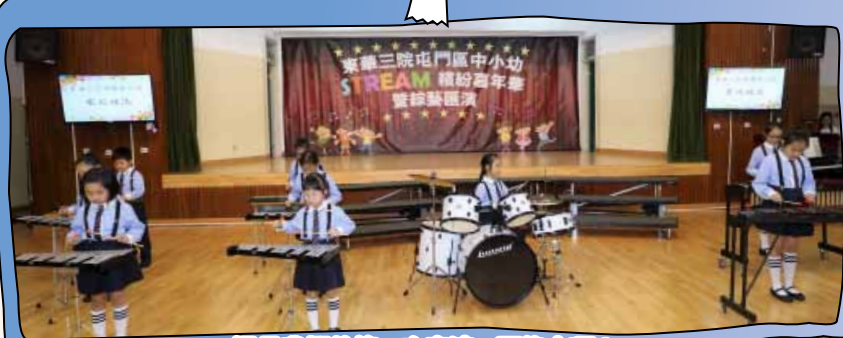
這是我們的第一次表演，要集中啊!