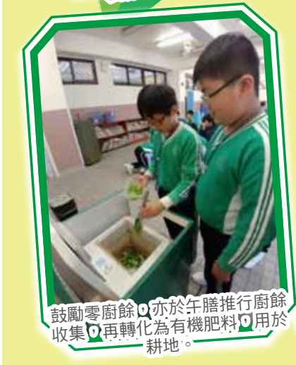
鼓勵零廚餘，亦於午膳推行廚餘收集，再轉化為有機肥料用於耕地。