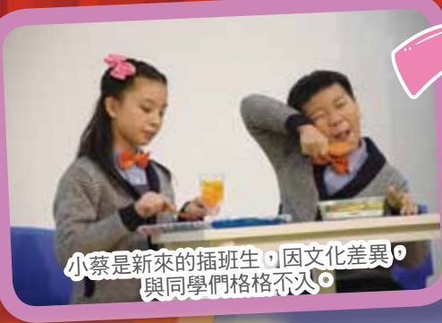
小蔡是新來的插班生，因文化差異，與同學們格格不入。