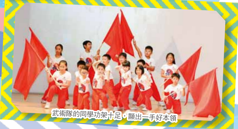
武術隊的同學功架十足，顯出一手好本領