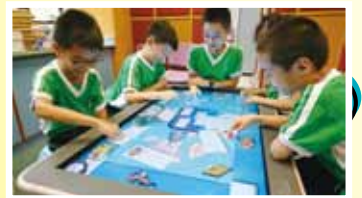
Our Activ table

With the use of e-learning tools such as the interactive learning table, which provides students with hundreds of learning games in respect to different learning areas, students are highly motivated to attain new knowledge.