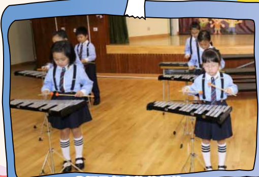
我們是負責旋律部的。