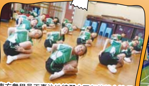
東方舞學員正專注地練習中國舞的基本技巧