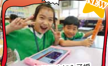
多元智能課也加入了編程教學，學生樂在其中