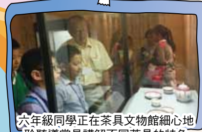
六年級同學正在茶具文物館細心地聆聽導賞員講解不同茶具的特色