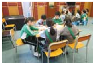
Students are doing worksheets for consolidation