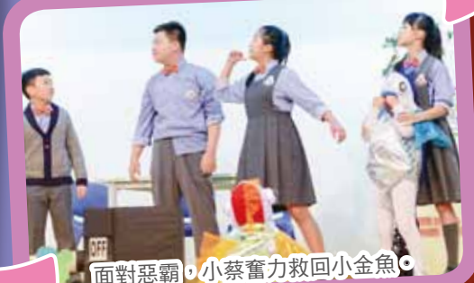
面對惡霸，小蔡奮力救回小金魚。