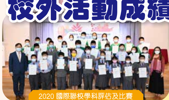
2020 國際聯校學科評估及比賽 (數學科) 各級得獎學生