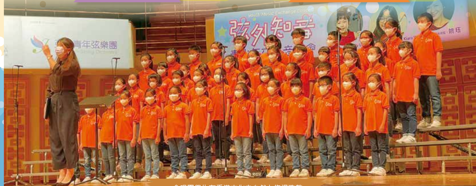
合唱團學生在香港文化中心獻上悠揚歌聲