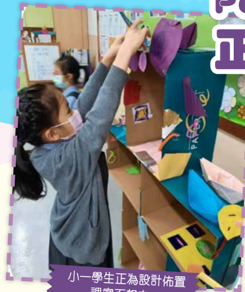
小一學生正為設計佈置課室而努力。