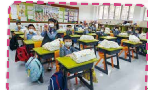
復課驚喜，愛心滿溢，成績可期