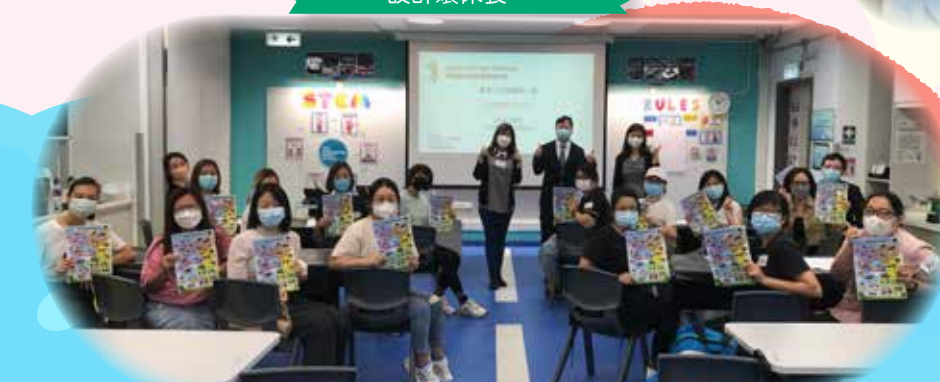
邀請專家到校進行正向家長工作坊，家長們都很支持。