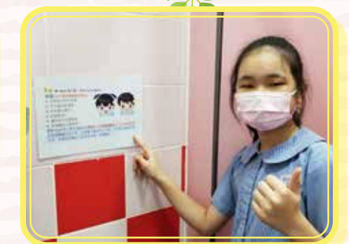
肇 Clean 精神藏於心