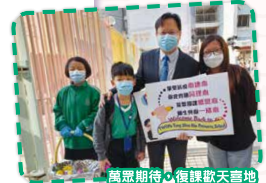
萬眾期待，復課歡天喜地