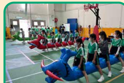
粽動員·慶端午—旱地龍舟競渡