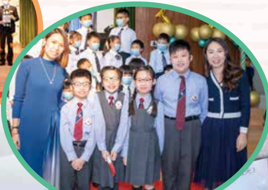
老師及學生小司儀粵英日語言介紹節目，表演專業自信