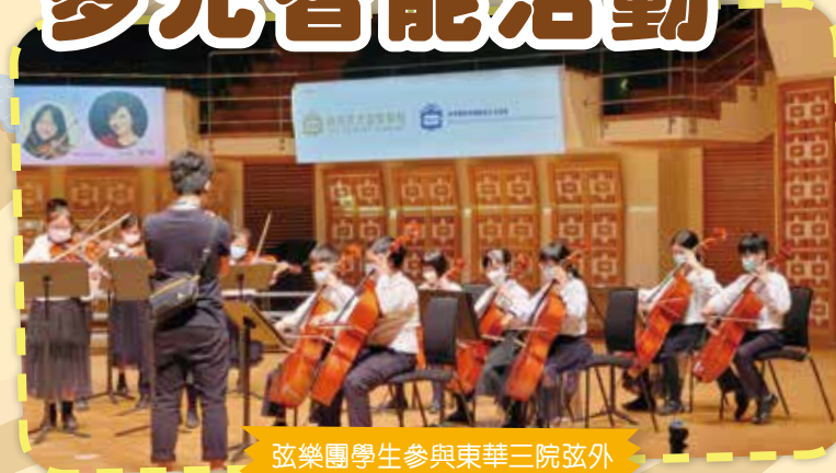
弦樂團學生參與東華三院弦外之音音樂會的精彩演出