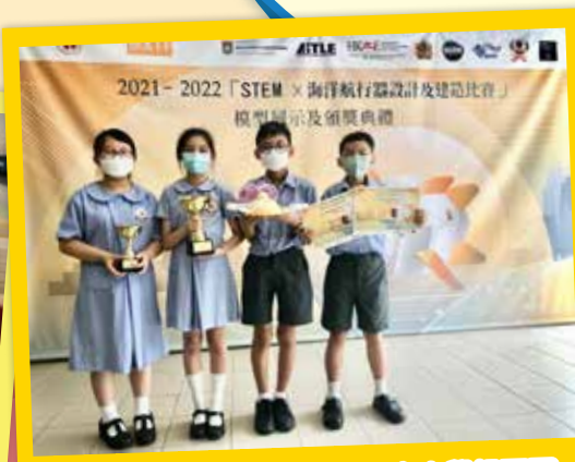
STEM x 海洋航行器設計比賽小學組亞軍