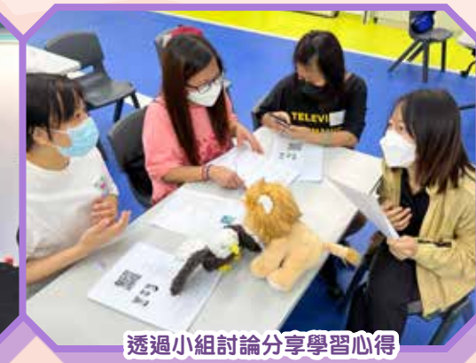
透過小組討論分享學習心得