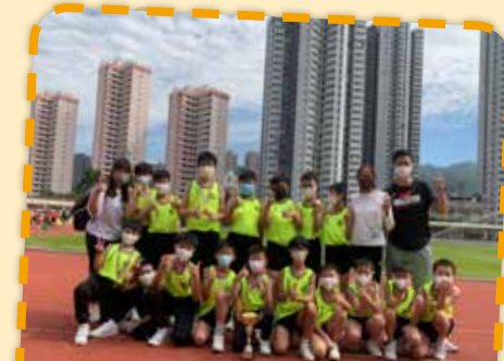
運動健兒在屯門區學界田徑比賽奪得殊榮