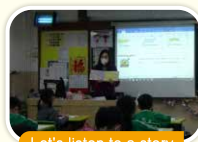
Let's listen to a story