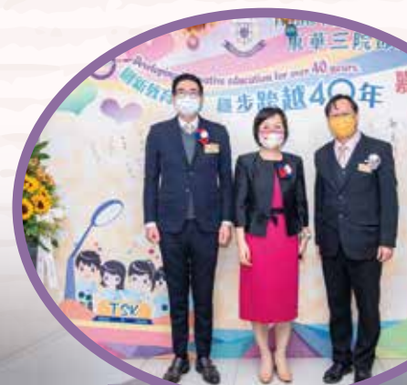
教育局副局長蔡若蓮博士, JP 親臨本校為 40 周年校慶作主禮嘉賓