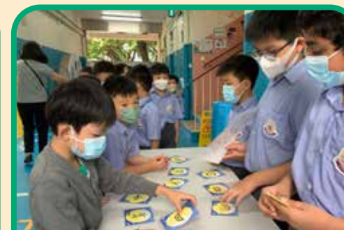
中文科端午節攤位活動