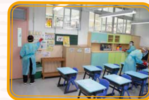
由心出發，徹底清潔