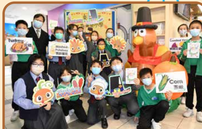
Happy Thanksgiving day! —「感恩心·願」