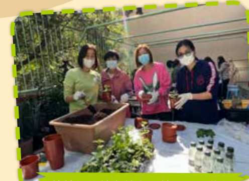
慈善年花義賣前家長義工用心栽種