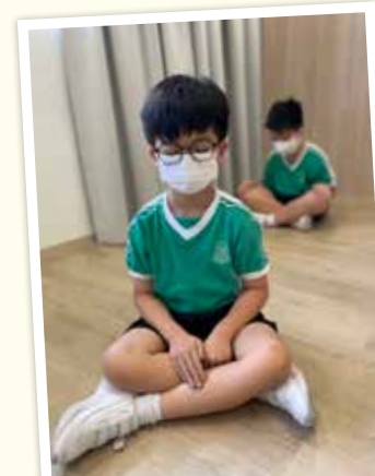
學生透過靜觀課能舒緩壓力，協助學生建立正向情緒。

本校推行電子版「正向大使獎勵計劃」。學校會持續表揚學生的優良學行表現，期望提高學生於各性格強項的自我管理動機和能力。家長可下載應用程式「EDX Student」，便能隨時隨地檢視電子獎勵紀錄，從而即時了解子女的學行表現。