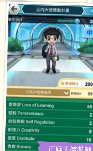
正向大使獎勵計劃電子版