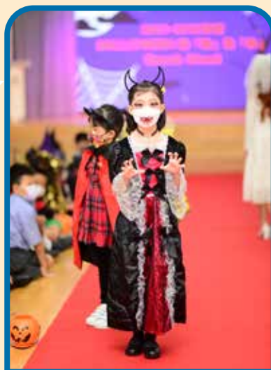
HALLOWEEN 整「飾」整「帥」 Speak Aloud Catwalk Show