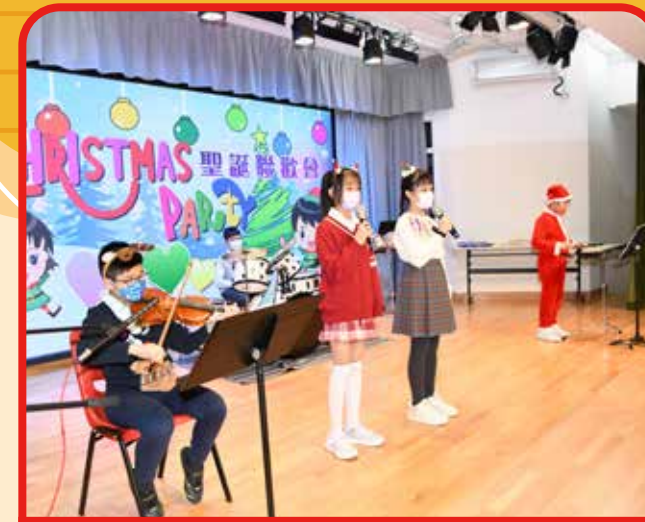
聖誕聯歡會—天才表演