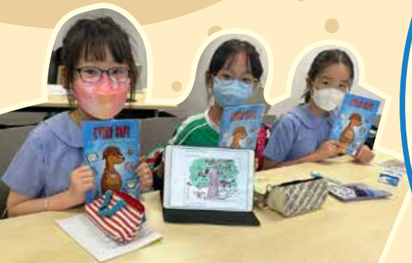
海洋公園 STEAM 工作坊

為協助學生發展運算思維能力，本校積極鼓勵學生參與全港性 STEM 比賽，並得到優異成績，值得鼓舞。