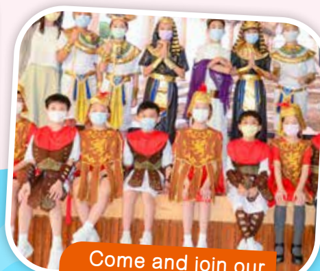
Come and join our drama team!