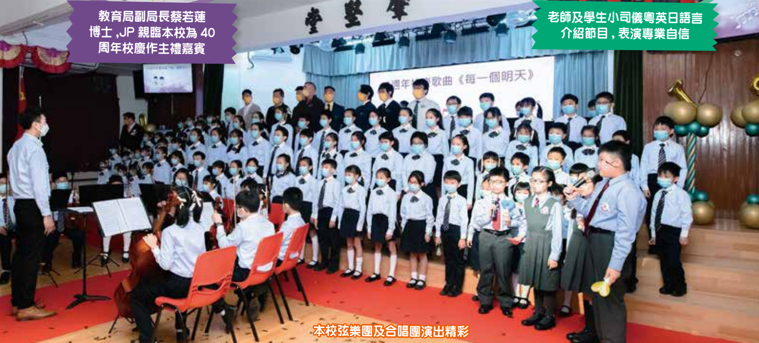
本校弦樂團及合唱團演出精彩