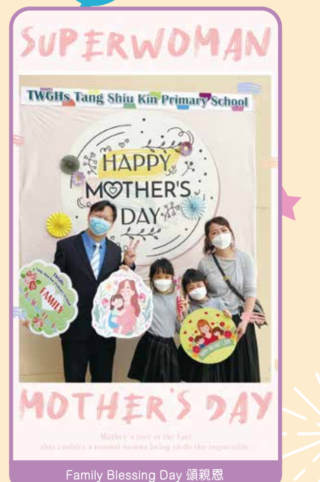
Family Blessing Day 頌親恩