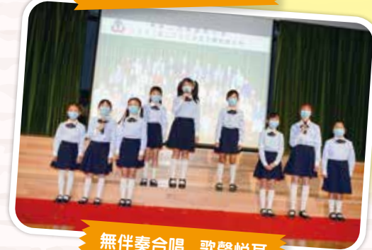
無伴奏合唱，歌聲悅耳