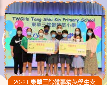
20-21 東華三院體藝精英學生支 援及獎勵計劃第二期得獎學生