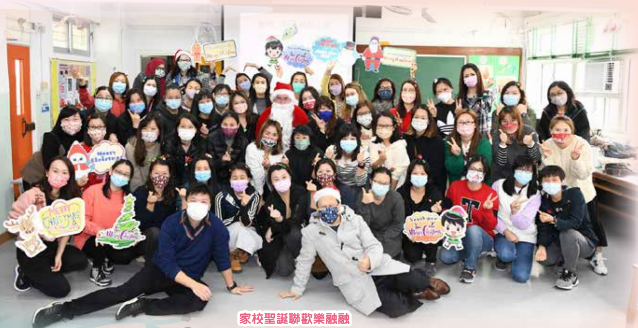
家校聖誕歡樂融融