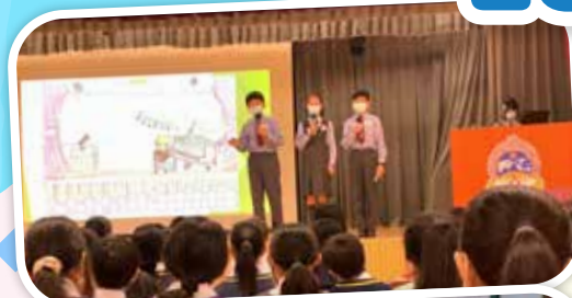
Storyboard Telling Competition

We aim at providing students with multi-learning platforms and experiences, thereby further sharpening students' skills in reading, writing, listening and speaking and uplifting students' motivation to learn English.