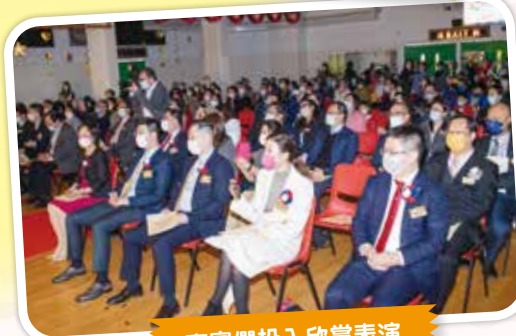
嘉賓們投入欣賞表演