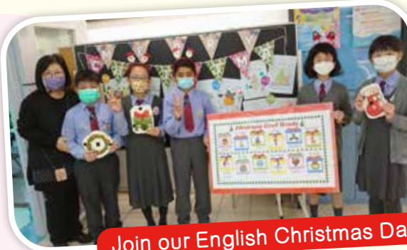
Join our English Christmas Day!