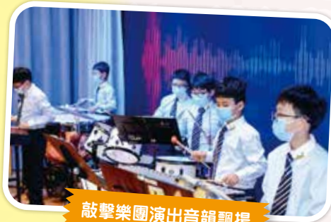
敲擊樂團演出音韻飄揚