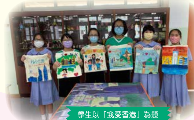
學生以「我愛香港」為題設計環保袋。