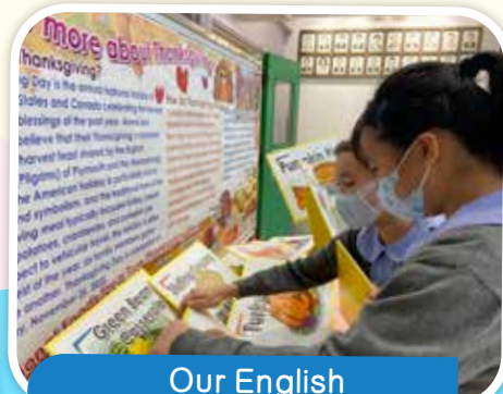
Our English ambassadors are helping to display the word cards of thanksgiving.