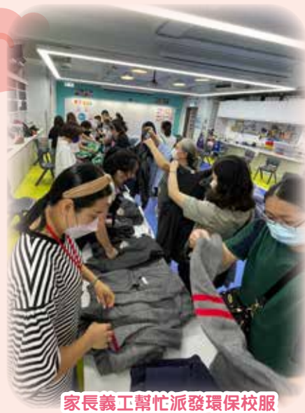
家長義工幫忙派發環保校服

任期即將屆滿，本人的 4 年的執委使命也將告一段落。在此寄語家長們，每一次家長義工的活動，都是讓我們學習的好機會。我們在鄧小大家庭內一起加油努力！