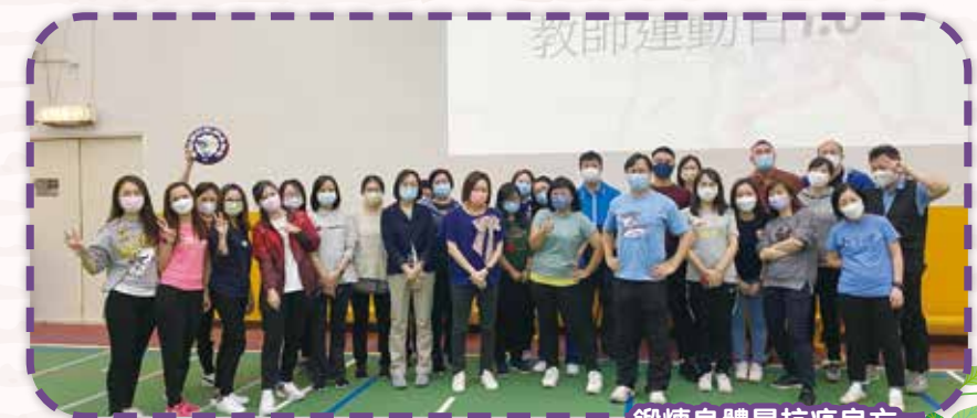
鍛煉身體是抗疫良方