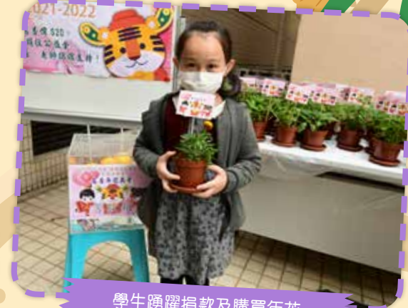
學生踴躍捐款及購買年花