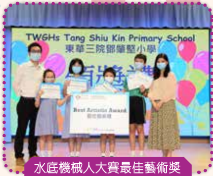
水底機械人大賽最佳藝術獎 及銀獎得獎學生