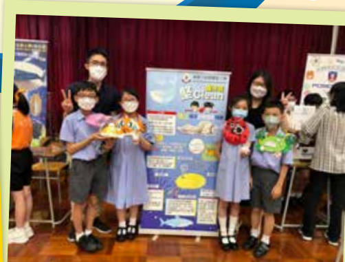
STEM x 海洋航行器設計比賽攤位