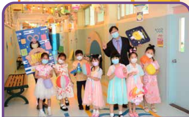
中秋節·慶團圓—賞燈會