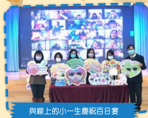
與線上的小一生慶祝百日宴