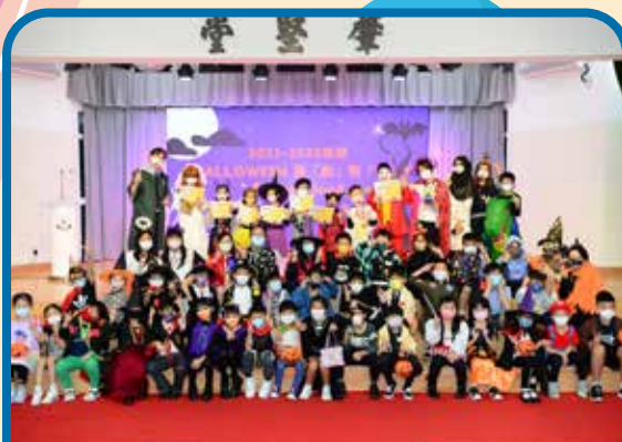
HALLOWEEN 整「飾」整「帥」Speak Aloud