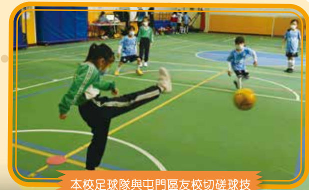
本校足球隊與屯門區友校切磋球技