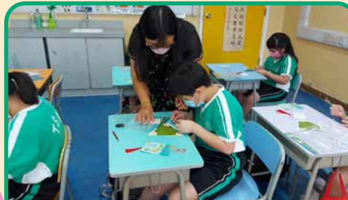
Morning Meeting 粽子掛飾 DIY