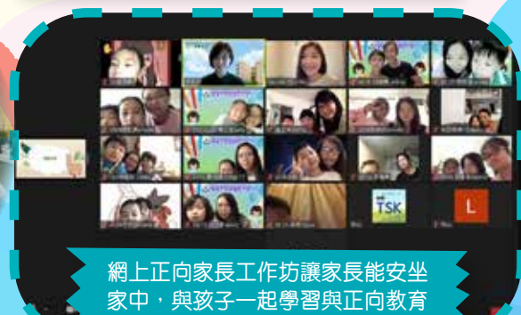
網上正向家長工作坊讓家長能安坐家中，與孩子一起學習與正向教育相關的課題。