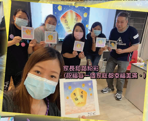
家長和諧粉彩 (祝福每一個家庭都幸福美滿。)