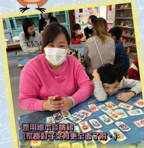
善用繪本談情緒 (家長對子女有更全面了解。)

學校一直重視家長教育，所以定期為家長舉辦各類豐富的課程及活動，活動涵蓋了互聯網問題、情緒管理、親子關係、壓力管理和自我成長等，以增加家長對育兒技巧的了解。期望家長透過各類課程及活動，能更了解子女成長的需要，促進良好的家庭溝通，家長與子女建立積極互動關係，並克服育兒面對的挑戰，營造健康、溫暖的家庭環境。