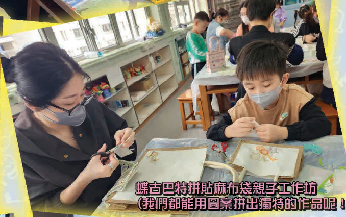
蝶吉巴特拼貼麻布袋親子工作坊 (我們都能用圖案拼出獨特的作品呢!)