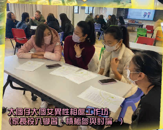
大個仔大個女異性相處工作坊 (家長投入學習，積極參與討論。)