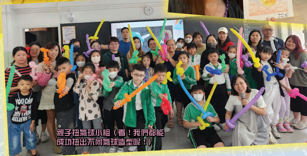
親子扭氣球小組 (看！我們都能成功扭出不同氣球造型呢!)