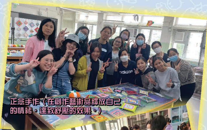
正念手作 (在創作藝術品釋放自己的情緒，達致舒壓的效果。)