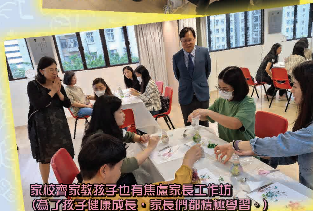
家校齊家教孩子也有焦慮家長工作坊 (為了孩子健康成長，家長們都積極學習。)